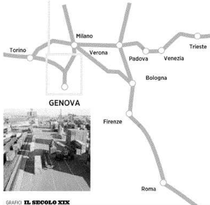
GRAFICI IL SECOLO XIX

Il primo progetto per il tunnel della Val Fontanabuona è datato 1860. L'opera, se sarà ultimata, consentirà a Rapallo di essere collegata direttamente con la vallata che si trova alle sue spalle