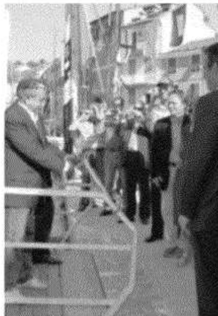
RISORSA Il pontile delle Grazie nel giorno in cui fu inaugurato

L'ACCORDO , al quale il Comune di Porto Venere partecipa con un impegno finanziario di 20.000 euro, consolida l'iniziativa assunta l'estate scorsa dall'Amministrazione guidata dal sindaco Massimo Nardini che ha riscosso «un così grande successo - è scritto in una nota autocologiativa dell'amministrazione comunale — tra i residenti e i turisti, in particolare delle frazioni comunali». Si consolida così l'uso nel pontile rinato alle Grazie sulle ceneri di quello esistente fino a 20 anni fa grazie al finanziamento dell'Autorità Portuale.