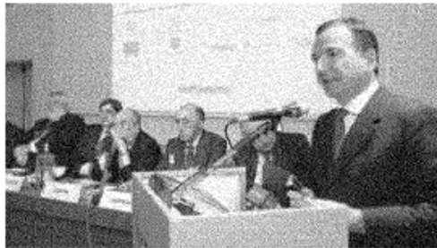
Il ministro degli Esteri Frattini alla presentazione del progetto triestino

Potrebbero bloccare il progetto giuliano e, tanto più, un'eventuale "esportazione" della piattaforma di Trieste a Nord Ovest. È una guerra di posizioni, equilibri tra istituzioni, interesse imprenditoriali. Tutte evocate ieri da Palenzona stesso con dichiarazioni un poco incendiarie. Arrivate, per altro, dopo che sul suo progetto si era abbattuta un fuoco di fila di dichiarazioni ostili da parte del presidente dell'associazione delle Autorità portuali italiane, Francesco Nerli, che aveva parlato di «privatizzazione strisciante e non condivisa». «Stupidaggini arcaiche, se Assoporti ha proposte alternative le dica: i soldi pubblici non ci sono» ha ribattuto Palenzona che poi ha ricostruito così le difficoltà sulla piazza del Nord Ovest formata dagli scali di Genova e Savona più gli inland terminal di Tortona e, in futuro, Alessandria. «Qui non c'è niente ed è più facile ragionare, il c'è una tortina da un milione e mezzo di container». Cioè, il movimento annuo del porto di Genova: chi lo gestisce oggi, è il messaggio, non gradisce tanto nuovi innesti. Ma Palenzona non si ferma lì: «Genova ha paura del nuovo, ma lì c'è un presidente di porto, Luigi Merlo, che capisce». Dichiarazione che sembra fatta apposta per scatenare una nuova ondata di diffidenza tra Nerli, contrario al 100% al progetto Unicredit, e Merlo che crede alla necessità di nuovi sistemi di investimento e intervento dei privati, ma sui meccanismi di finanziamento e su