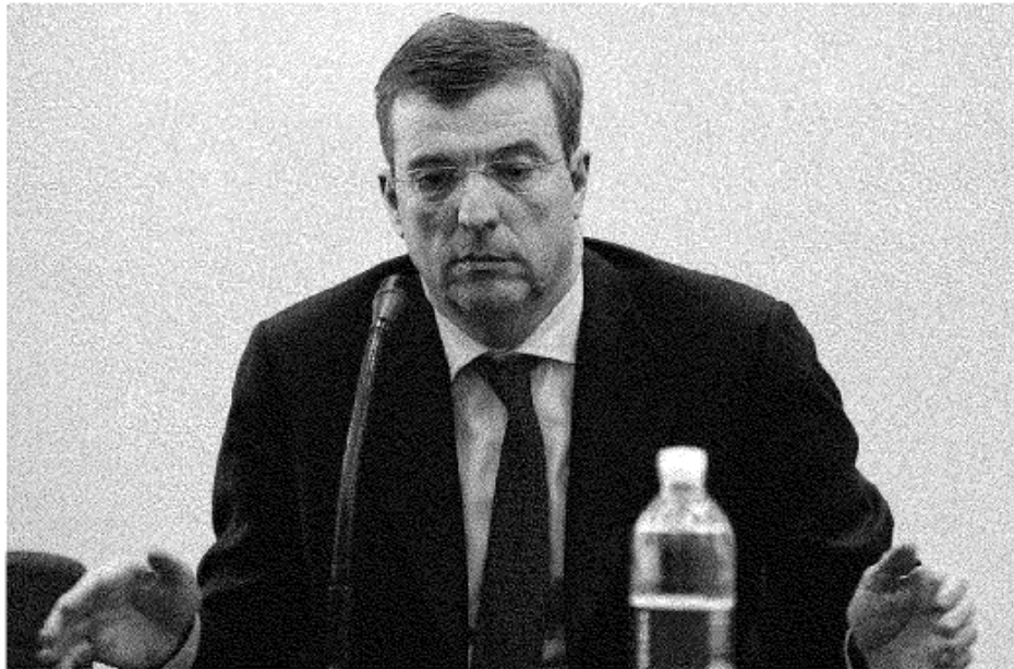
ISOLATO Il governatore Claudio Burlando è stato sommerso da una valanga di proteste per il suo rifiuto a firmare l'accordo sul Terzo valico

Dopo aver minacciato di boicottare domani il protocollo d'intesa sulla nuova autostrada, il presidente della Regione si spaventa di fronte alla valanga di reazioni contrarie e annuncia «la possibilità di raggiungere in tempo un accordo»